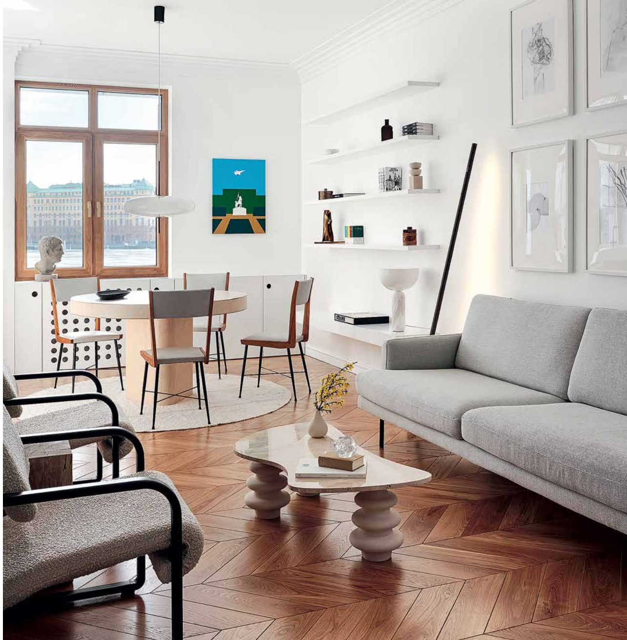
Лаконичный интерьер ретроквартиры на Петровском острове построен на сочетании винтажной мебели и современного искусства.