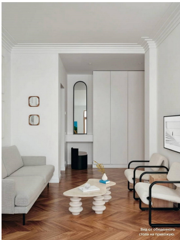
Вид от обеденного стола на прихожую.